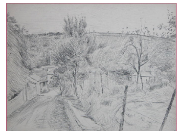
Musée des Ursulines

Si le paysage peut constituer le référent identitaire d'un vin , il convient d'en caractériser les réalités géographiques afin d'en saisir les potentialités exploitables et ses dynamiques.